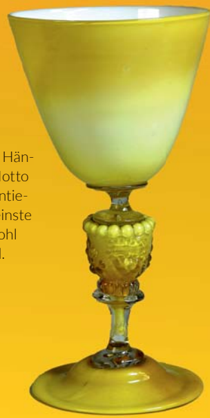
Religiöses, Mängelstück, Antonio Salviati, Murano/Venedig, 1860–1880, Überfragliche, verschnittenen, Höhe: 45,5 cm, 1914, angekauft im Berliner Kunsthandel