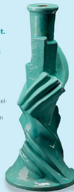
Gerard Weidanz 1989–1970 Großer Leuchter, 1922/1924, 45 cm, Tuffwanne, grüne Zinglaur © Weidanz/Gastus Weidanz, Foto: Piusbaum/Bertram Kaber