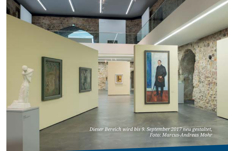
Dieser Bereich wird bis 9. September 2017 neu gestaltet

*** Bei Vorlegen der Eintrittskarte gibt es einen ermäßigten Preis für das Tagesgericht im MoritzKunstCafé