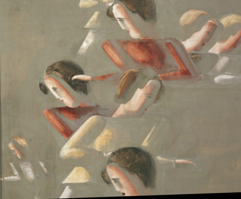
Oskar Schlemmer: Rot gegeneinander (Ausschnitt), 1928, Öl und Tempera auf Leinwand, 116,2 x 90 cm, Osthaus Museum, Hagen, Foto: Achim Kukulies, Düsseldorf