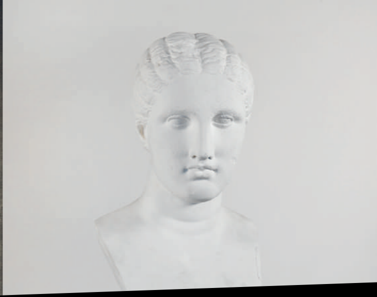
Umkreis des Praxiteles: Frauenkopf („Der Brunnsche Kopf“), Gips, 61,20 x 29 x 30,5 cm, Karlsruhe, Staatliche Kunsthalle Karlsruhe