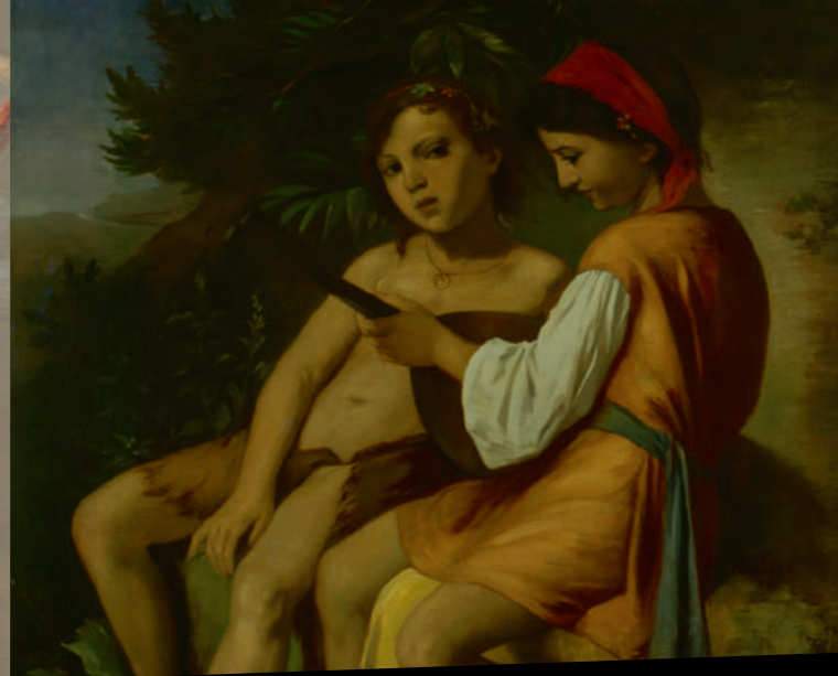
Anselm Feuerbach: Musizierende Kinder (Ausschnitt), 1864, Öl auf Leinwand, 106,5 x 87 cm, Kulturstiftung Sachsen-Anhalt - Kunstmuseum Moritzburg Halle (Saale), Foto: Klaus E. Göltz

Die Ausstellung steht im Kontext der Winckelmann-Jubiläen 2017/18, des 300. Geburtstages des Gelehrten am 9. Dezember 2017 sowie des 250. Todestages am 8. Juni 2018, und ist eine der zentralen Veranstaltungen im Land Sachsen-Anhalt.