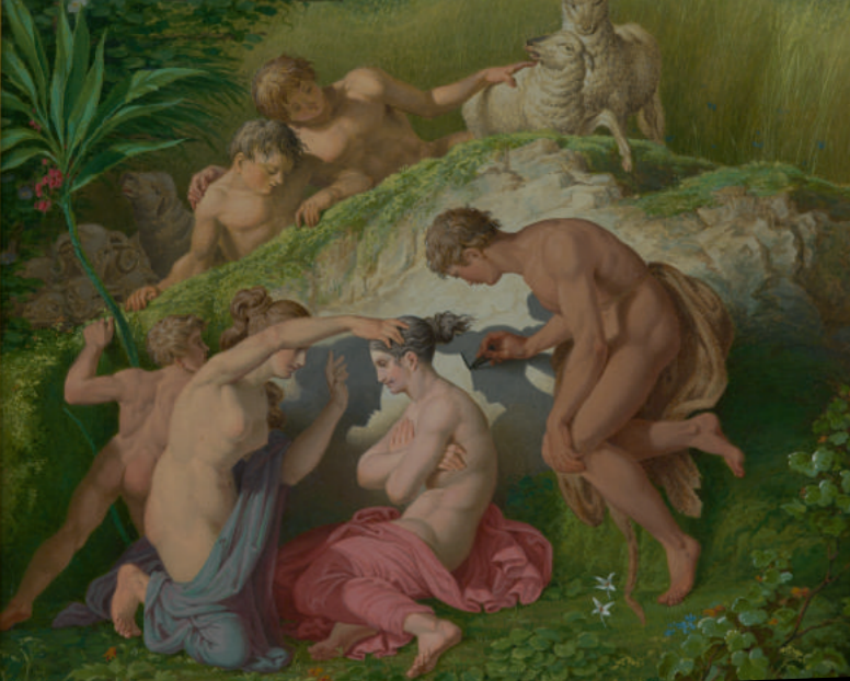
Karl Friedrich Schinkel: Die Erfindung der Malerei (Ausschnitt), 1830, Gouache, 26 x 29 cm, Von der Heydt-Museum Wuppertal