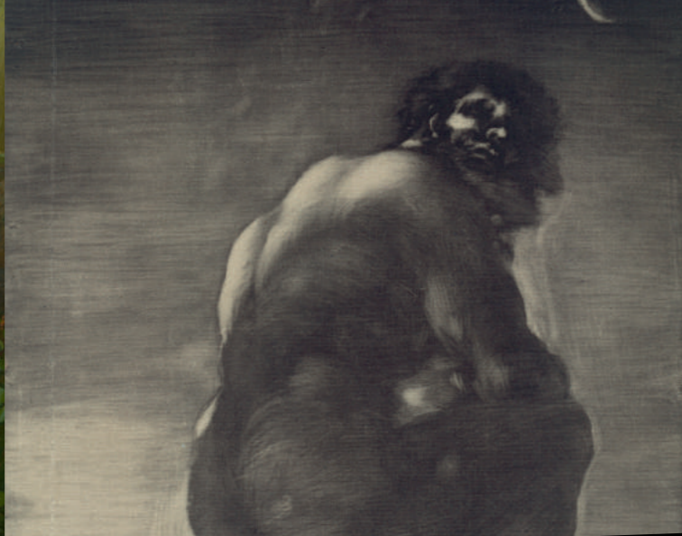
Francisco José de Goya y Lucientes: Der Koloss (Ausschnitt), vor 1830, Aquatinta, 28,5 x 20,6 cm, Kupferstichkabinett, Staatliche Museen zu Berlin, Foto: bpk / Kupferstichkabinett, SMB / Jörg P. Anders