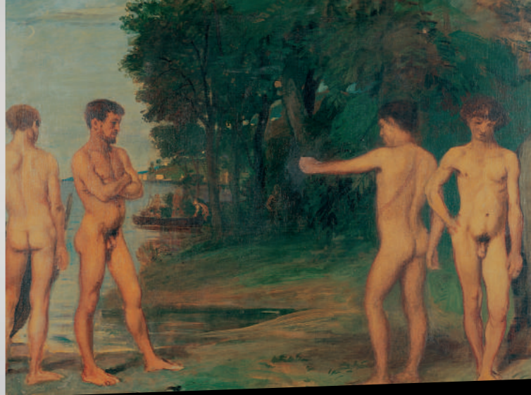
Hans von Marées: Männer am Meer (Ausschnitt), um 1874, Öl auf Leinwand, 77 x 101 cm, Von der Heydt-Museum Wuppertal, Foto: Antje Zeis-Loi, Medienzentrum Wuppertal

MAX BECKMANN, HERMANN BLUMENTHAL, ARNO BREKER, FRIEDRICH WILHELM EUGEN DÖLL, HANS-PETER FELDMANN, ANSELM FEUERBACH, FRANCISCO DE GOYA, WALDEMAR GRZIMEK, ERWIN HAHS, HERMANN HALLER, EUGEN HOFFMANN, MAX KLINGER, GEORG KOLBE, HANS VON MARÉES, ADOLPH MENZEL, OTTO MEYER-AMDEN, GEORG MINNE, PHILIPP OTTO RUNGE, KARL FRIEDRICH SCHINKEL, OSKAR SCHLEMMER, RUDOLF SCHLICHTER, GEORG SCHOLZ, GEORG SCHRIMPF, MORITZ VON SCHWIND, CARL ADOLF SENFF, HORST STREMPER